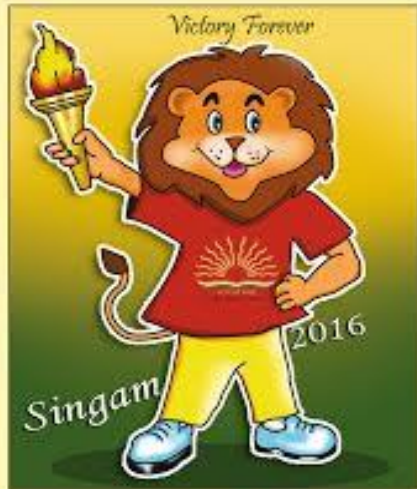
47 th KVS NATIONAL SPORTS MEET-2016 Chennai Region Mascot

The country doesn't deserve anything less than success from us. Let us aim for success - A.P.J. Abdul Kalam