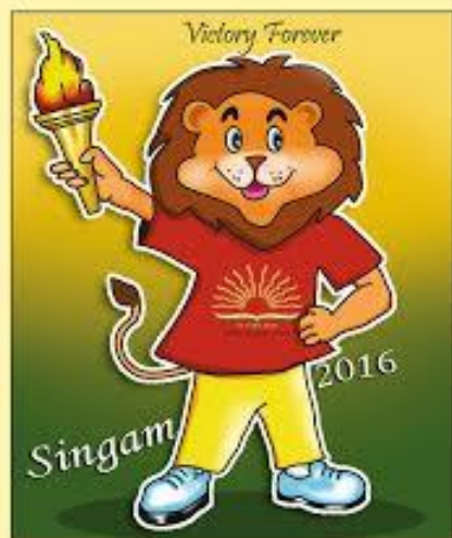
47 th KVS NATIONAL SPORTS MEET-2016 Chennai Region Mascot

The country doesn't deserve anything less than success from us. Let us aim for success - A.P.J. Abdul Kalam