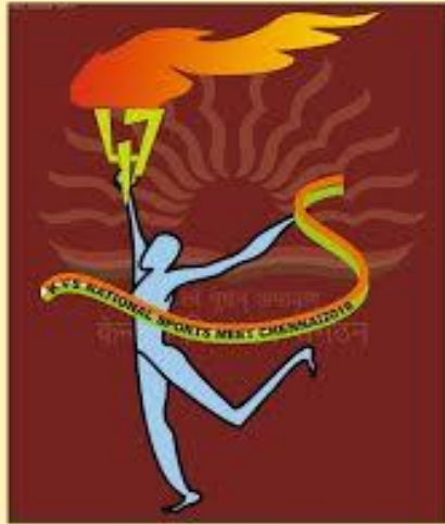
47 th KVS NATIONAL SPORTS MEET-2016 Chennai Region logo